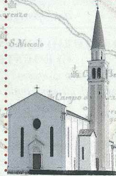
PARROCCHIALE DI SAN DANIELE CAVALIER