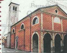
CHIESA DI SANTA MARIA MADDALENA ODERZO