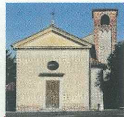
CHIESA DI SAN PRODOCIMO PORTOBUFFOLÈ