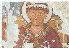
ORATORIO DI SAN CLEMENTE CODOGNÈ