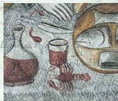
ORATORIO DI SAN GIORGIO SANPOLO DI PIAVE