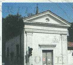
ORATORIO DI SAN GIUSEPPE ODERZO