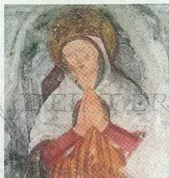
ORATORIO MADONNA DELLA CAMINADA SANPOLO DI PIAVE

FEDE, ARTE E MUSICA NELLE CHIESE DEL TERRITORIO