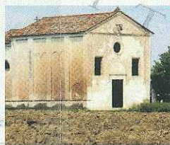
ORATORIO NATIVITÀ DI MARIA SALGAREDA