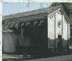
CHIESA DI SAN BONIFACIO LEVADA