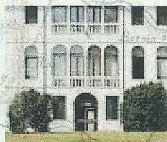
PALAZZO FOSCOLO ODERZO