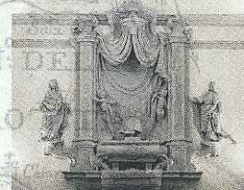
DUOMO DI SAN NICOLÒ MOTTA DI LIVENZA